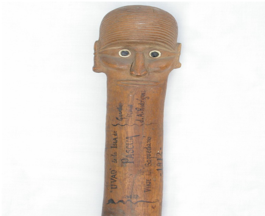
Paoa, maza de guerra

Este trabajo bibliográfico quiere ser una invitación, una puerta abierta en los registros del conocimiento, que facilite el acceso al misterio de la soledad oceánica que explica la magnificencia de los moai y el genio inspirador de sus escultores.